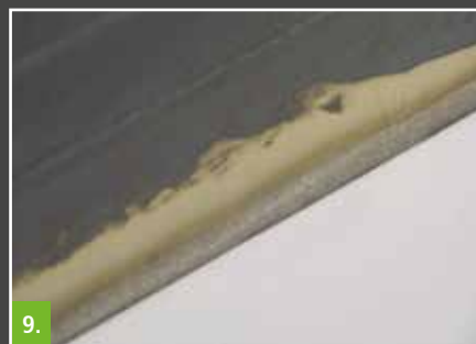
9. Beispiel: Wannendichtband Botament® SB 78 WB mit aufgeklebtem Schnittschutz/Überarbeitung mit z. B. Botament® DF 9