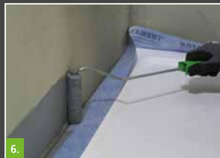
6. Wannendichtband in die erste Lage der Verbundabdichtung einbetten