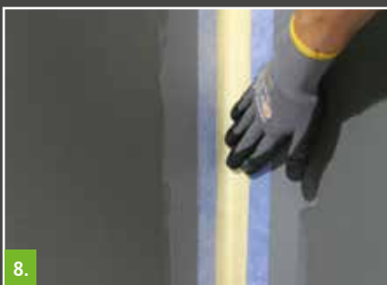
8. Beispiel: Einbau Systemdichtband SB 78 mit aufgeklebtem Schnittschutz/ Einbettung in die erste Lage der Verbundabdichtung