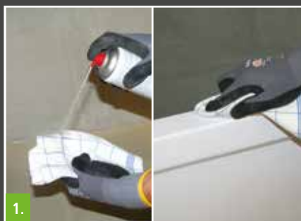
1. Wannenrand vorab mit lösemittelfreiem Reiniger säubern