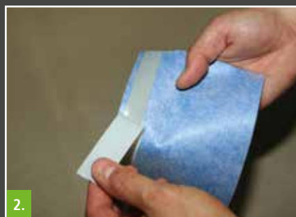
2. Schutzfolie vom Butylstreifen abziehen und das Band blasen- und faltenfrei (ohne Unterbrechung in den Eckbereichen) ankleben