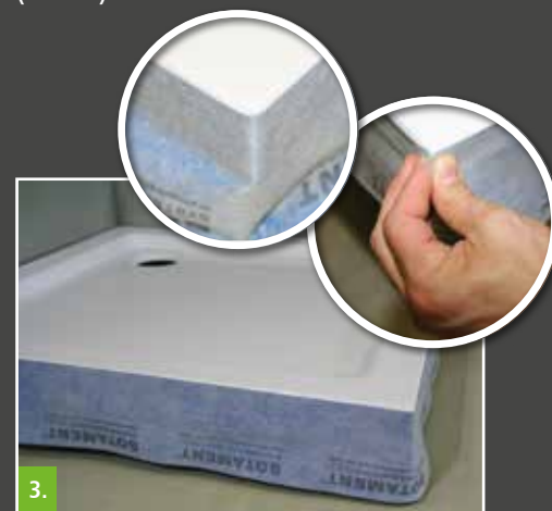
3. Optional (abhängig vom Wannenradius): Ausbilden einer Tasche zur Herstellung einer spannungsfreien Innenecke