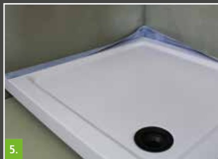
5. Wanne fachgerecht montieren lassen